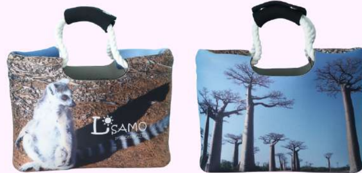
ロープトートバッグ

こちらは裏表にそれぞれ違う写真を印刷。 旅行の記念や大切なペットの写真などの バッグが作れます♪