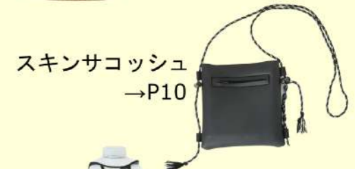
スキンサコッシュ →P10