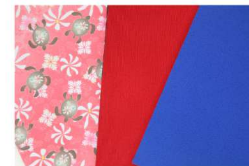
厳選の国産ネオプレン生地