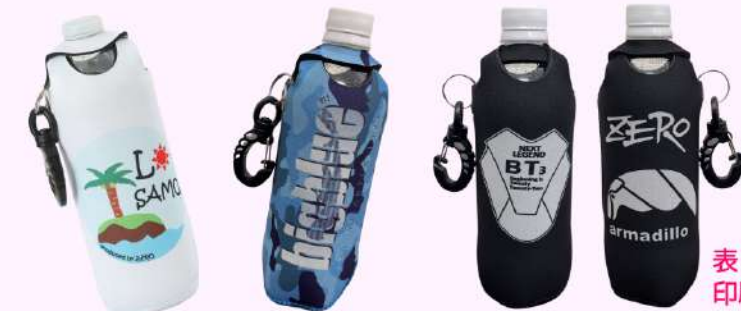
ペットボトルカバー

こちらは裏表にそれぞれ違う写真を印刷。 旅行の記念や大切なペットの写真などの バッグが作れます♪