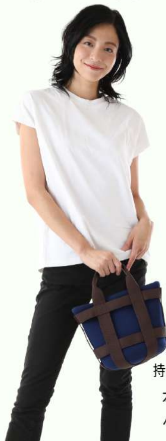
持ち手ショート仕様 本体：NAVY ベルト：BROWN