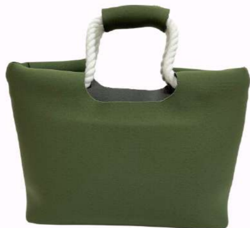
ロープトートバッグ