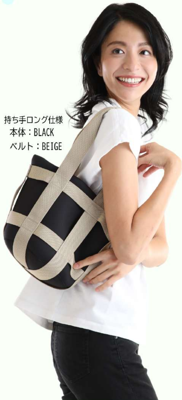
持ち手ロング仕様 本体：BLACK ベルト：BEIGE

防水のインナーバッグで、飲み物も冷やせちゃう！ 持ち手はショートとロングの2タイプからお選びいただけます！