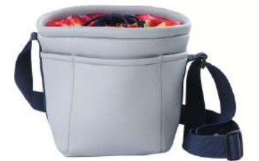
ピクニックバッグ →P18