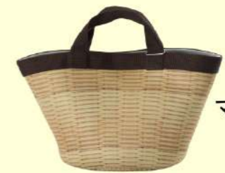
マルシェトートバッグ →P9