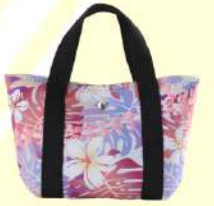
ネオプレン トートバッグ →P6