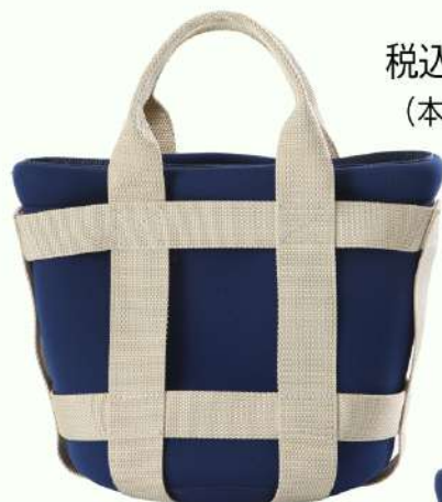
持ち手ショート仕様