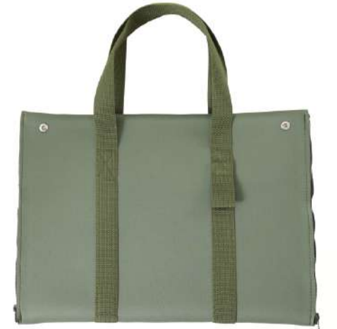
MULTI WAYバッグ →P14