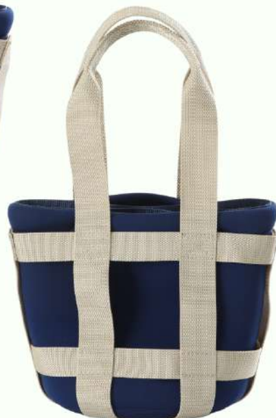
持ち手ロング仕様