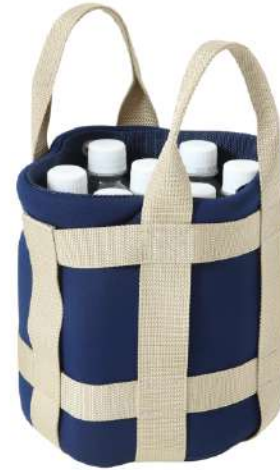
2WAYベルネットバッグ →P16