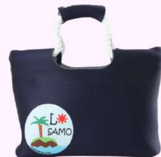
ロープトートバッグ

ワッペン風にワンポイントで ロゴを入れたバッグ。 ショップやブランドのロゴを 使ってオリジナルバッグに！