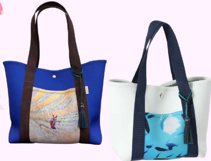
ネオプレントートバッグ Mサイズ ポケットにのみ写真を印刷したもの。 勿論本体にも印刷可能です！

エルサモは、1点ずつの受注作製。だからこそ、お客様のご希望を叶えることが出来るんです！写真やイラスト、オリジナルのロゴなどを印刷して、世界で一つだけのオリジナル商品を作ってみませんか。