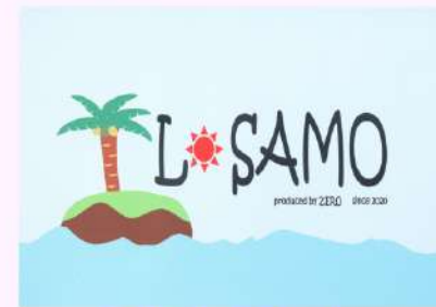
ネオプレンマット

クッション性に優れたネオプレンマットは、 電子機器用のマットにもオススメ。また、 オシャレにロゴなどを印刷してディスプレイ としても活躍します！ご希望のサイズで作製 可能です。