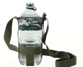
2Lペットボトルホルダー →P19