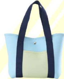
ロープトートバッグ →P8